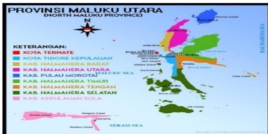
Gambar: Peta Provinsi Maluku Utara

Wilayah kerja Balai POM di Sofifi dan Loka POM di Kabupaten Kepulauan Morotai adalah seluruh provinsi Maluku Utara, mempunyai luas wilayah seluruhnya 31.982 km 2 .